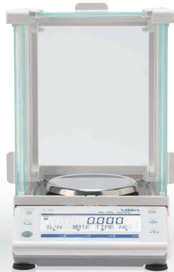
ALE223 (R)~623 (R)